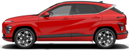
Engine Red Solid